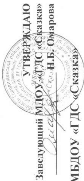
ГРАФИК ПРОХОЖДЕНИЯ АТТЕСТАЦИИ ПЕДАГОГОВ МБДОУ «ГДС «Сказка» в период с 2022 по 2027 учебные года